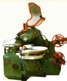
↑ Wrapping machine GD 2500