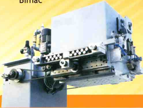
↓ Tempering Machine EX 5 Bi.mac