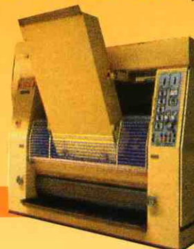
↓ Refiner Buhler 1300 Hydraulic