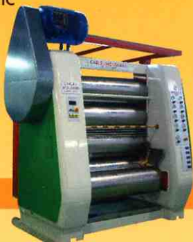
↓ Refiner C&M 1300 Hydrostatic