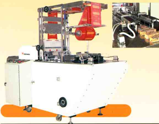
↓ Overwrapping type horizontal packing machine