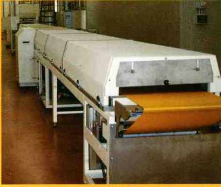
↓ Cooling Tunnels Bimac →