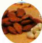
↓ Roasting Probat RO 1500 da 300 Kg-bacth