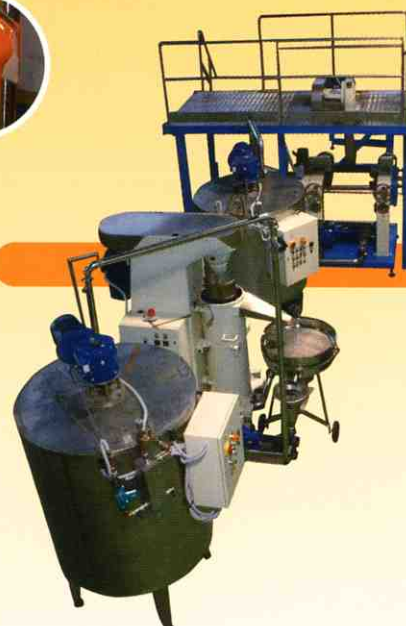
↓ Plant for natural and sugar cream