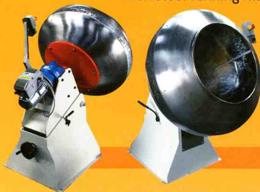
Inox steel Panning machines Line Bimac →