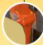
↓ Plant for natural and sugar cream