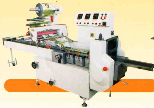
↓ Flow-Pack packaging machines