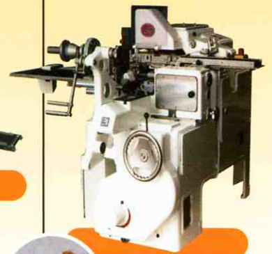
↓ Wrapping machine Sig CK